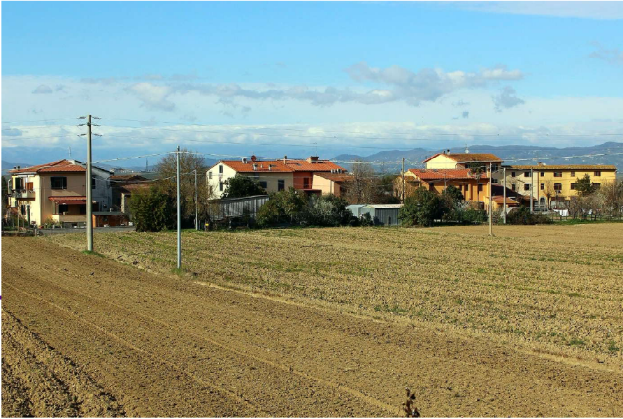
Sant'Angelo a Montorzo oggi.